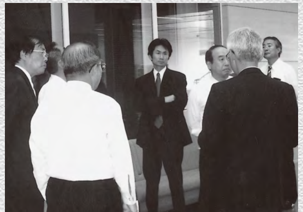
いわき市総合保健福祉センター視察