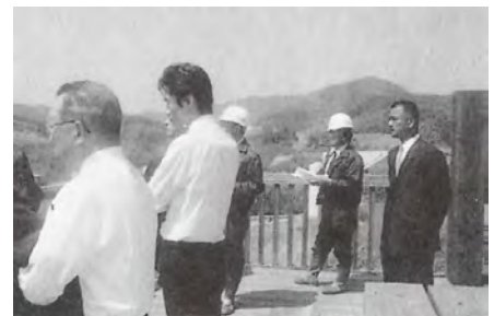
大分川ダム建設進捗状況調査

会派では・・ 今回のこの補正予算は、今年度限りのものがあったり、もっと生活に密着したものに遣うべきだという問題があります。ただ、国からの経済危機対策の予算であり、必要な事業もあることから、承認しました。