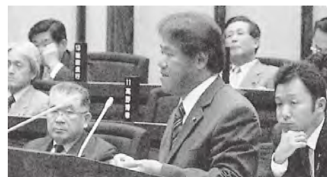
2回目以降の質問 (議員席の最前列から) ※2回目以降は議員席側に場所を移動して、質問します。