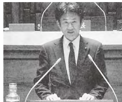
1回目の質問 (議長前の演台から)