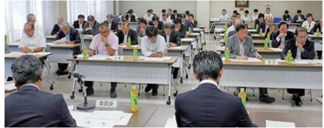
9月議会での決算審査委員会

9月1日～28日まで開催されました。今議会では、前半は今年度の補正予算と新たに提案される議案について審議し、後半は前年度の決算の審査を行いました。