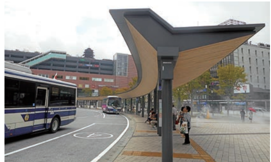
駅府内中央口のバス停

会派として、食の安全・食育・学校教育への影響等を質し、子どもに影響がないよう強く要望しました。